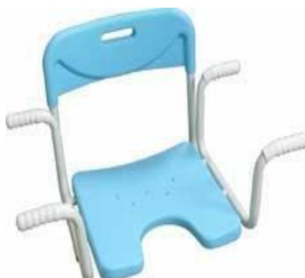
Vanová sedačka otočná: 13,-/den