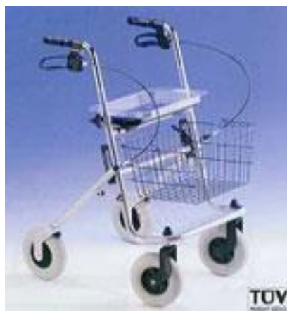
Chodítko čtyřkolové rollátor: 17,-/den