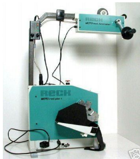
Motomed dle typu: 35 - 40,-/den (vratná záloha: 3000,-)