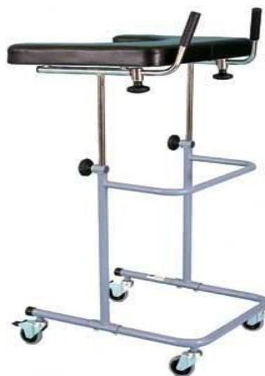
Chodítko pultové: 17,-/den