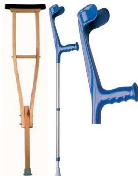
Francouzské a podpažní berle: 10,-