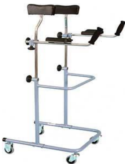
Chodítko podpažní: 17,-/den