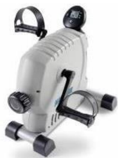
Rehabilitační šlapadlo: 15,-/den