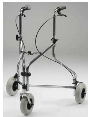
Chodítko tříkolové: 17,-/den