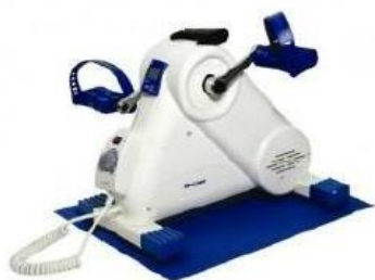
Active cycle (elektrické): 20,-/den