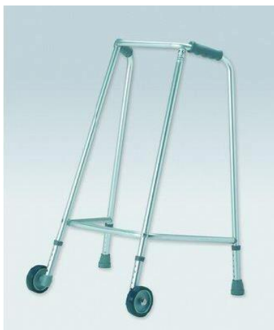
Chodítko dvoukolové pevné: 15,-/den