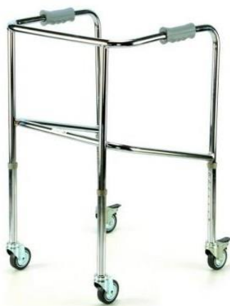
Chodítko čtyřkolové pevné: 15,-/den