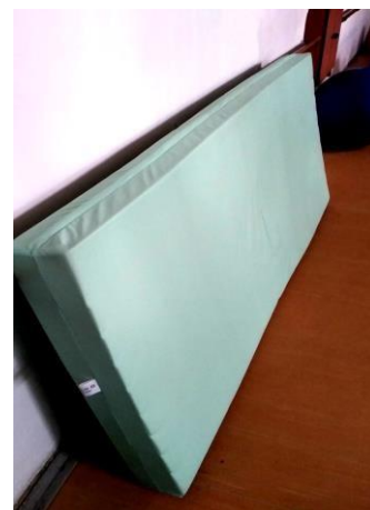
Molitanová matrace v omyvatelném potahu: 10,-/den