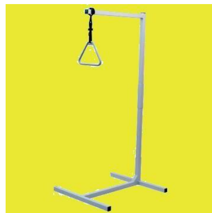
Samostatná hrazda k lůžku: 15,-/den