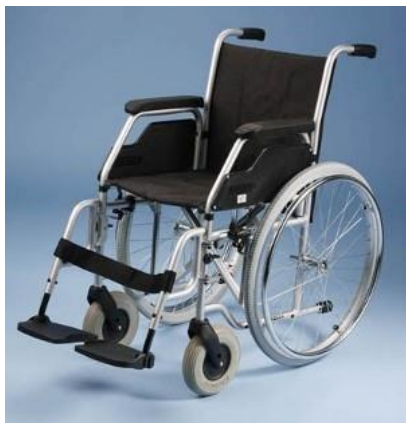
Mechanický vozík: 30 – 40,-/den (vratná záloha: 2000,-)