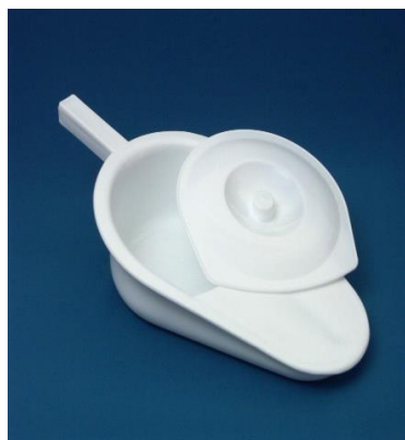
Podložní mísa: 10,-/den