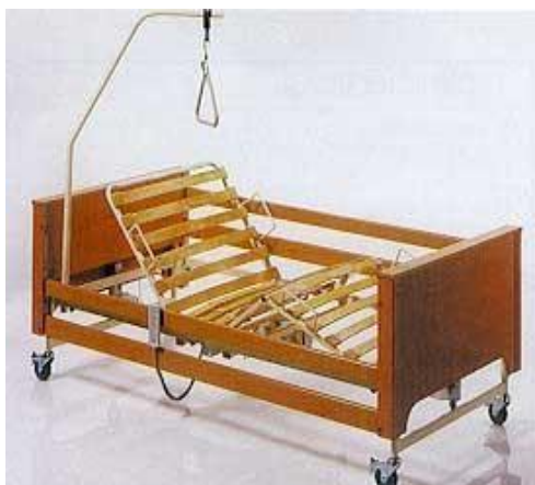
El. Polohovací lůžko: 30,-/den (vratná záloha: 2000,-)