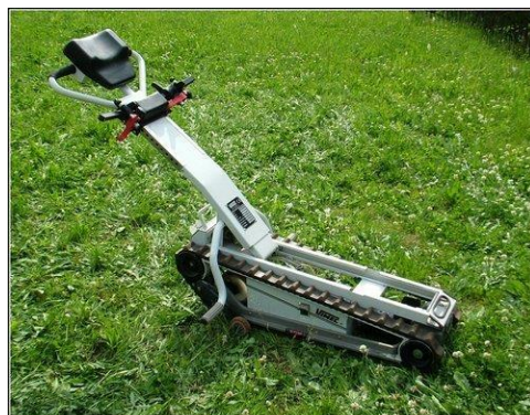
Schodolez pásový (nutno s vozíkem) 30 - 50,-/den (vratná záloha: 3000,-)