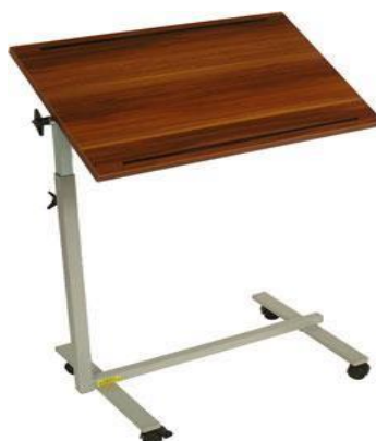
Stolek k lůžku: 10,-/den