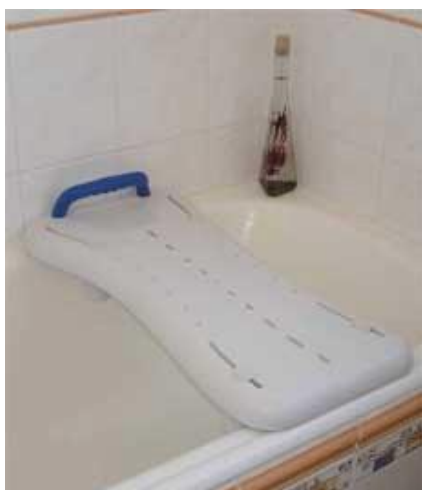
Vanová sedačka – deska: 10,-/den