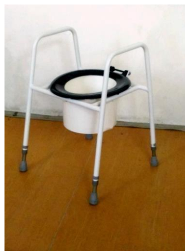
Nástavec na WC přenosný s madly: 13,-/den