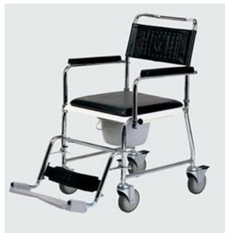
Klozetové křeslo pojízdné: 20,-/den