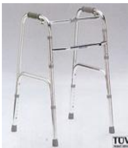
Chodítko skládací: 15,-/den