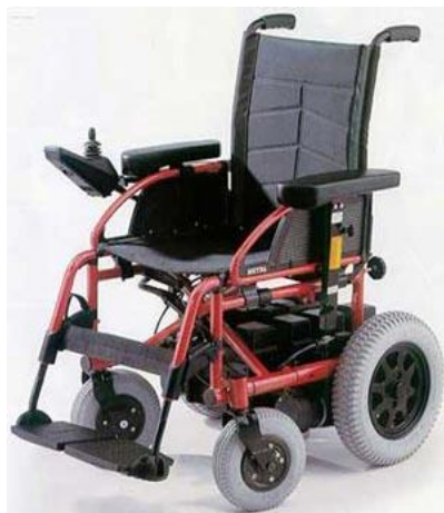
Elektrický vozík: 45,-/den (vratná záloha: 2000,-)