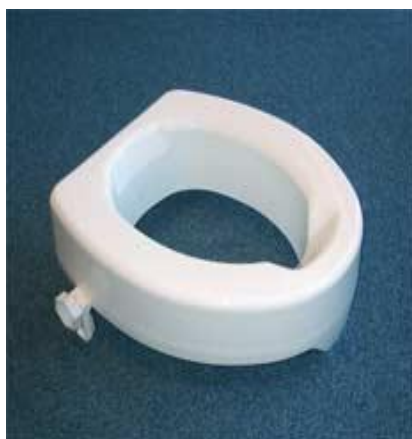
Nástavec na WC (různé výšky): 7,-/den