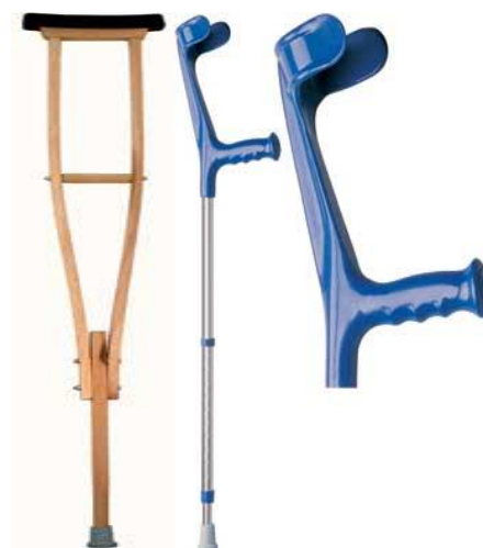
Francouzské berle a hole: 5,-/den