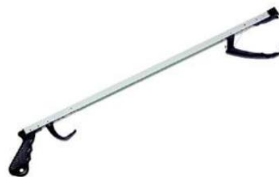
Podavač předmětů: 5,-/den