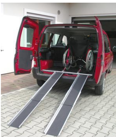
Nájezdové ližiny: 15,-/den