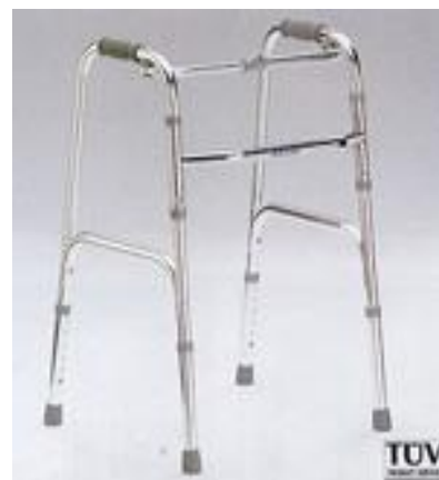
Chodítko čtyřbodové skládací 15,-/den