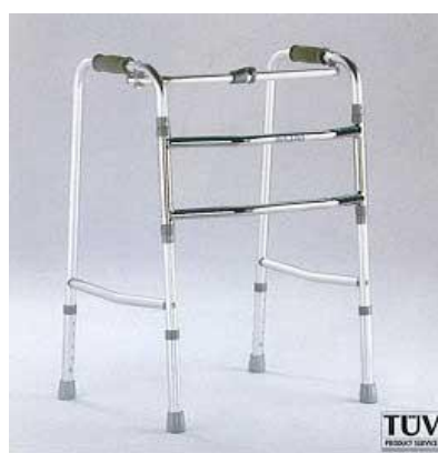
Chodítko kloubové: 15,-/den