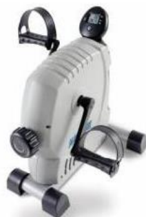
Rehabilitační šlapadlo: 15,-/den