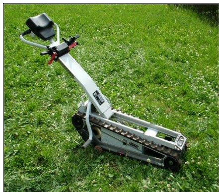
Schodolez dle typu: 30 – 50,-/den (vratná záloha 3000,-)