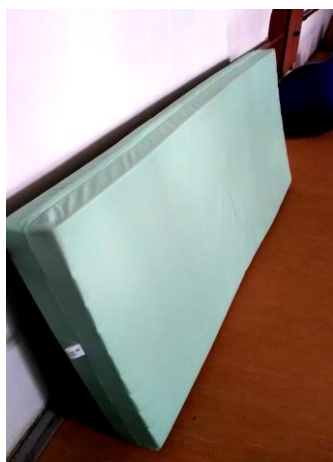
Molitanová matrace v omyvatelném potahu: 10,-/den