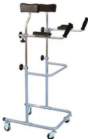
Chodítko podpažní: 17,-/den