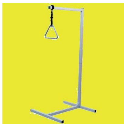
Volně stojící hrazda k lůžku: 15,-/den