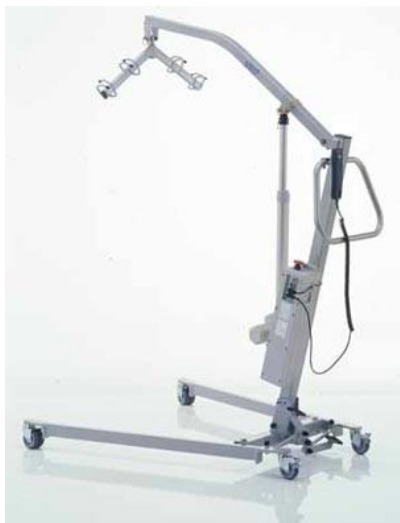
Elektrický zvedák: 25,-/den (vratná záloha: 2000,-)