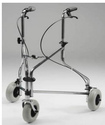
Chodítko tříkolové 17,-/den