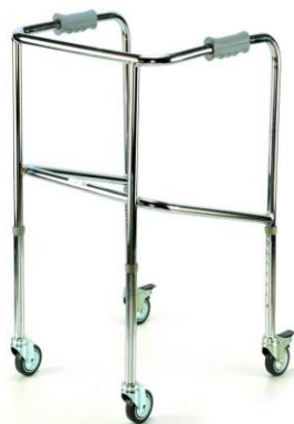
Chodítko čtyřkolové pevné: 15,-/den