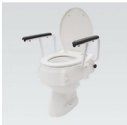
Nástavec na WC s madly: 10,-/den