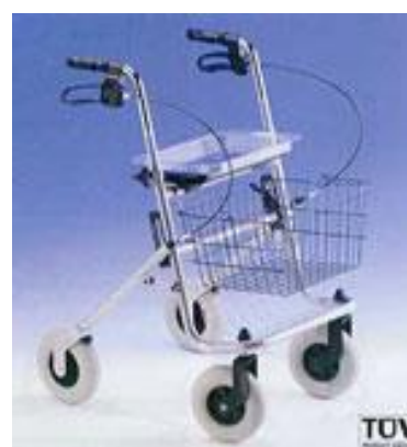
Chodítko čtyřkolové: 17,-/den