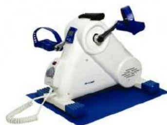
Activ Cycle (elektrické): 20,-/den