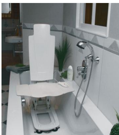
Vanový zvedák: 20,-/den (vratná záloha: 2000,-)