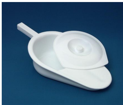
Podložní mísa: 5,-/den