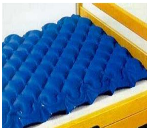
Antidekubitní matrace s kompresorem: 20,-/den