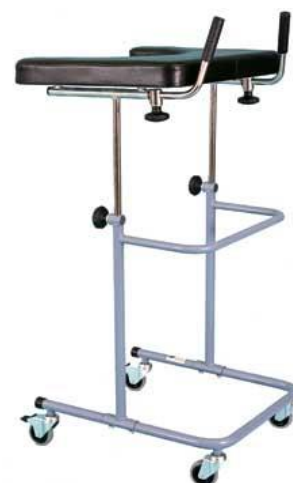
Chodítko pultové: 17,-/den