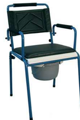
Toaletní židle pevná: 15,-/den