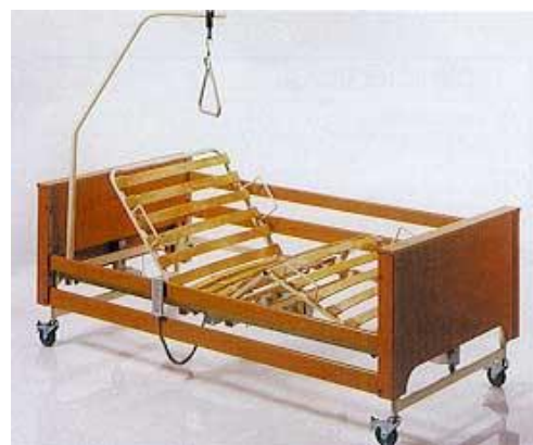
El. polohovací lůžko: 30,-/den (vratná záloha: 2000,-)