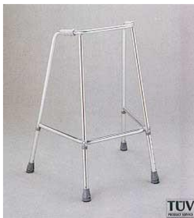
Chodítko čtyřbodové pevné: 15,-/den