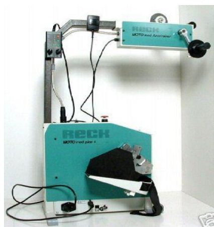
Motomed dle typu: 35 - 40,-/den (vratná záloha: 2000,-)