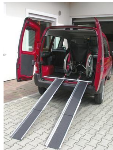
Nájezdové ližiny: 25,-/den (vratná záloha: 2000,-)