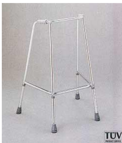
Chodítko čtyřbodové pevné: 20,-/den