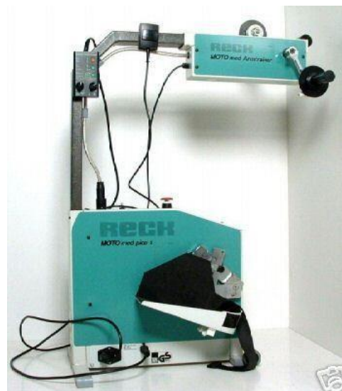
Motomed dle typu: 35 - 40,-/den (vratná záloha: 3000,-)