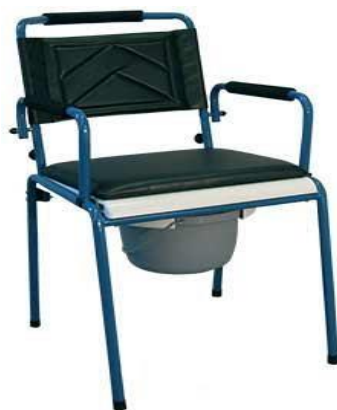
Klozetové křeslo pevné: 20,-/den