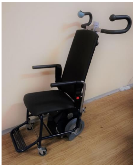
Schodolez kolečkový se sedačkou: 50 - 70,-/den (vratná záloha: 3000,-)