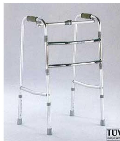
Chodítko kloubové: 20,-/den