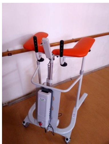
Chodítko pultové elektrické: 30,-/den